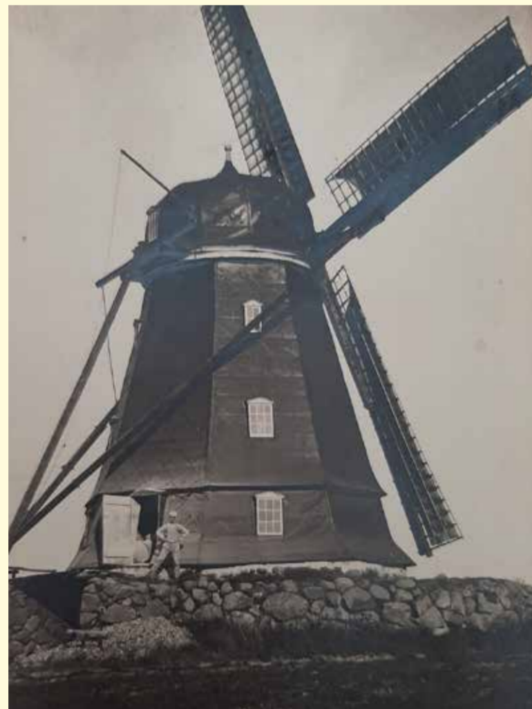
Nykulla kvarn, okänt årtal.

Halvvägs mellan Ryngge gård och nuvarande järnvägen låg Rynggeängen tillhörande Sjörupsk kyrka. Området blev känt under "Det skånska bondeupproret" 1811, under Karl XIV Johans första regeringsår. "Vi möts i Ryngge" var fältropet som upprorsmakarna skulle samlas kring när de drog från slott till slott och protesterade mot inkallelser till krigstjänst. Det är också titeln på Tore Zetterholms berömda roman om det dramatiska upproret.