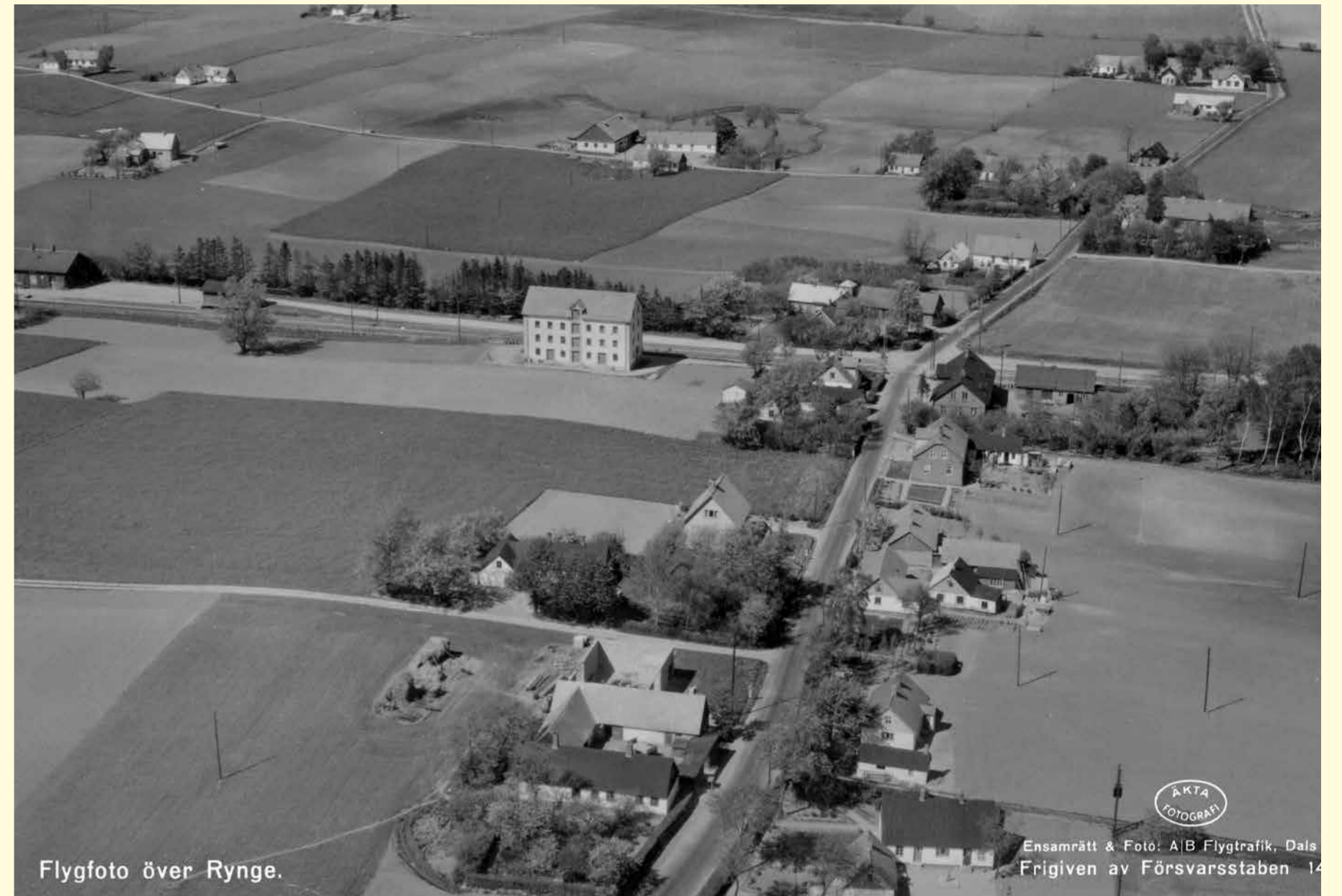
Flygfoto 1956 KM 85976.6843