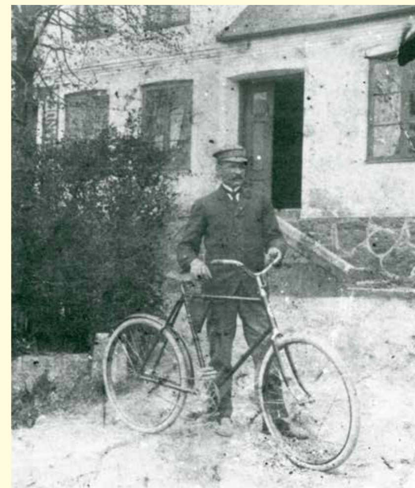
NP Sjörin, troligen på 1910-talet.