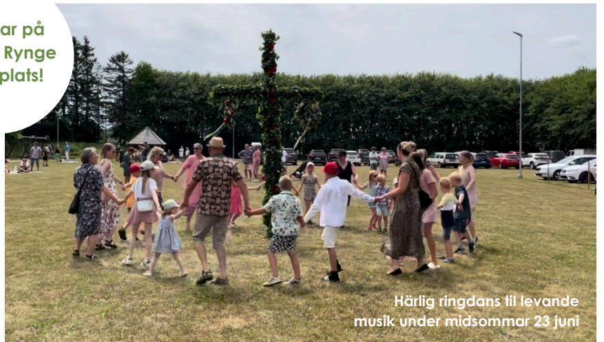
Härlig ringdans till levande musik under midsommar 23 juni

Mer info om priser och förutsättningar, se hemsidan