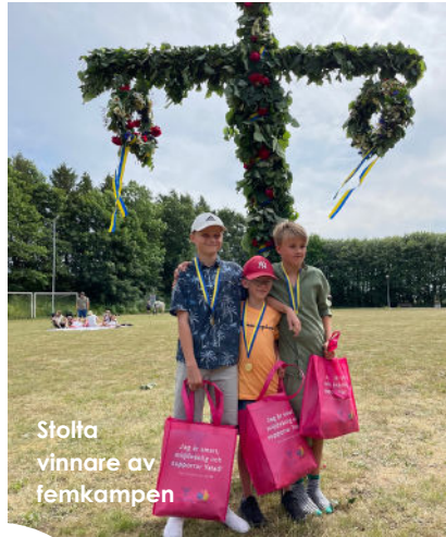
Stolta vinnare av femkampen