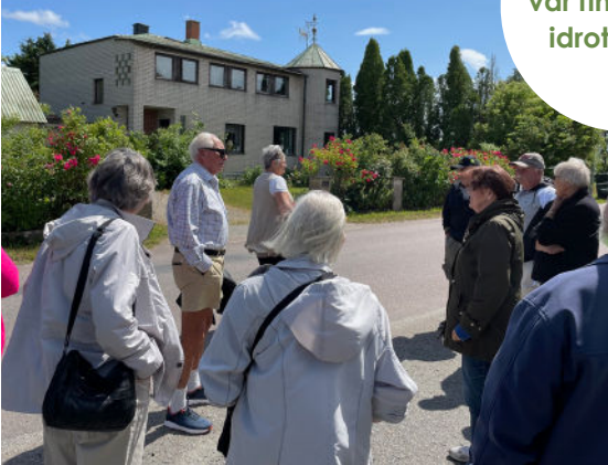
Skyttvandring om byarnas historiska fastigheter, 2 juli