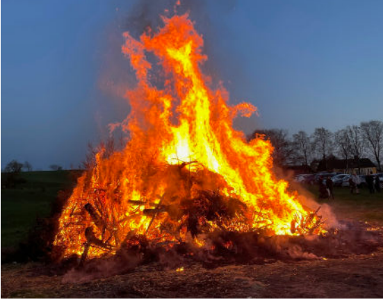
Valborg i Holahög 30 april