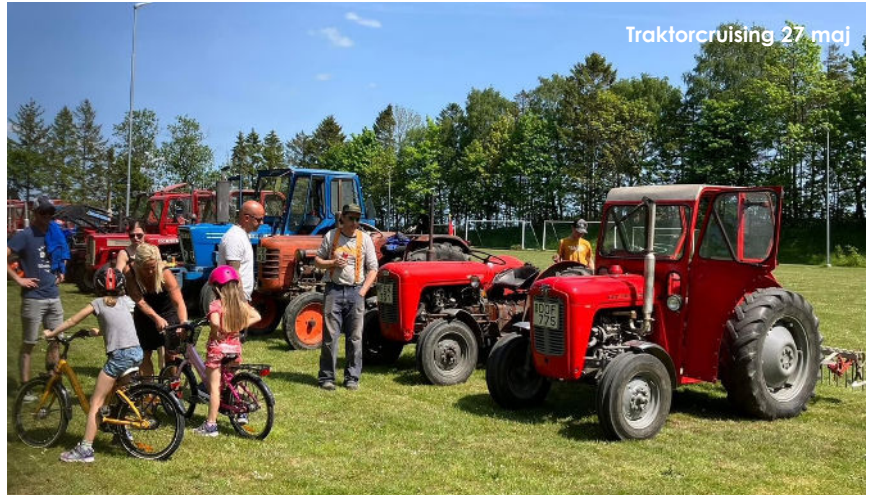
Traktorcruising 27 maj