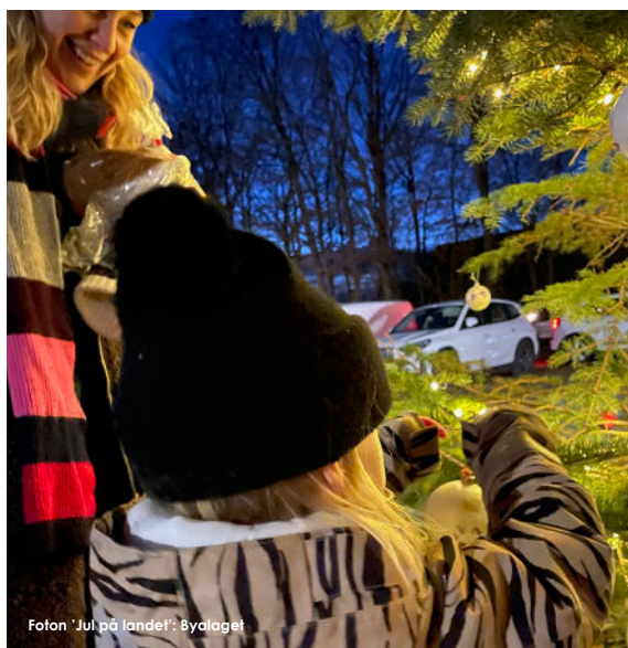
Foton 'Jul på landet': Byalaget